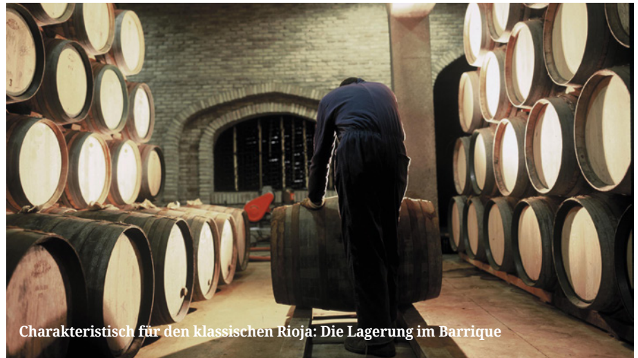
Charakteristisch für den klassischen Rioja: Die Lagerung im Barrique

Trotz des immer wieder viel betonten Trends in Richtung generischer Weine und dem damit verbundenen Verzicht auf die traditionellen Qualitätsstufen, entfielen auf die klassischen Prädikate gut zwei Drittel der Top Hundert. Insbesondere die immer wieder unterschätzte Crianza-Klasse konnte mit 27 Proben zeigen, dass für moderates Geld in Rioja viel Wein geboten wird. Hier taten sich zahlreiche unbekannte Bodegas hervor. Namen wie Berzal, Domeco de Jarauta, Perica und Obalo – alles Betriebe, die klar am Terroir orientiert arbeiten und nur in geringem Maße zukaufen – konnten die Verkoster überzeugen. Gleichauf lagen die Reservas gefolgt von zehn Gran Reservas. Unter den Weinen dieser letzten Gruppe brillierten einige Erzeuger mit Höchstbewertungen und stellten klar, dass Gran Reservas auch in einer breiten Verkoster-Runde bestehen können und nicht, wie so oft behauptet, als überholtes Weinprofil wahrgenommen werden. Dabei kamen die Weine der Top-Kategorie nicht nur aus alteingesessenen Häusern. Namen wie Olabarri, Navarrosillo oder Finca Nueva schnitten sehr gut ab. Bemerkenswert waren auch die Ergebnisse für die Gran Reservas von Campillo oder Bujanda, Marken, die eigentlich eher für zurückhaltende und wenig spektaku-