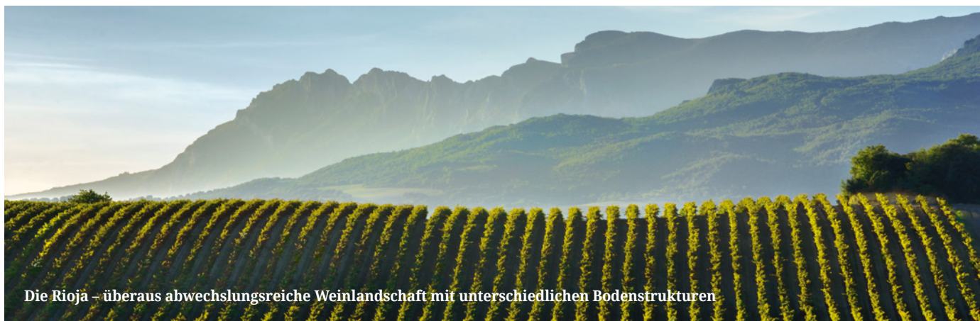
Die Rioja – überaus abwechslungsreiche Weinlandschaft mit unterschiedlichen Bodenstrukturen

mit dieser Kategorie arbeitet und damit auch ein Zeichen setzt. Das Thema Weißwein gewinnt bei einer zunehmenden Zahl an Produzenten an Bedeutung und dürfte aller Wahrscheinlichkeit nach der nächste große Trend in Rioja werden. Gemeint sind nicht die einfachen, konventionell gearbeiteten frisch-fruchtigen Qualitäten sondern die sogenannten »elaboraciones especiales«. Die Rede ist von gereiften Weinen aus ausgesuchten Lagen, wie sie sonst nirgendwo in Spanien gekeltert werden. Neben den klassischen Sorten Viora und Malvasía zeigen inzwischen auch die neuen autochthonen Trauben Profil. Maturana blanca und Tempranillo blanco könnten den riojanischen Weißweinen ein völlig neues Gesicht geben und als holz-ausgebaute Spezialitäten ganz nebenbei die Reserva- und Gran Reserva-Kategorie für Weißweine wieder neu beleben. Man kann also durchaus gespannt sein, was die Zukunft bringen wird.