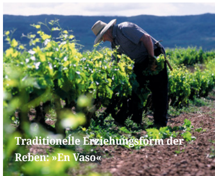
Traditionelle Erziehungsform der Reben: »En Vaso«

Die DOCa Rioja ist zweifellos die bekannteste unter den Tempranillo-Appellati-